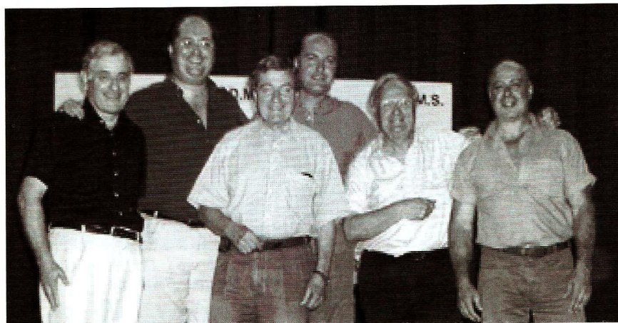
La giuria della prova di selezione per il 53° Trofeo Mondiale di Fisarmonica di Acquappesa

A tutti i partecipanti al 53° Precampionato Mondiale, la giuria e i direttori artistici del concorso hanno consegnato coppe, medaglie e diplomi messi a disposizione dalle Autorità di San Marino.